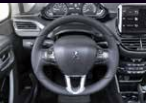
VOLANTE SPORT DRIVE EN CUERO

Conducir se vuelve más sencillo y divertido con la ayuda del Peugeot Connect Aio de 7" con Apple CarPlay y Android Auto.