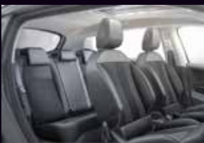
ASIENTOS CON NUEVO REVESTIMIENTO EN CUERO Y TELA