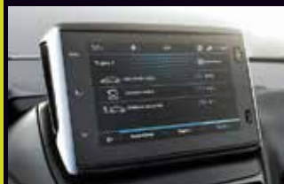
CENTRAL MULTIMEDIA PEUGEOT CONNECT 7"

El nuevo Peugeot 2008 Style viene equipado con el motor 1.6 Turbo con cambio automático para que domines las respuestas en las carreteras. La versión STYLE TURBO está equipada con el motor más potente de la categoría, además del sistema Grip Control, que garantiza el agarre de las ruedas incluso en los terrenos más difíciles.